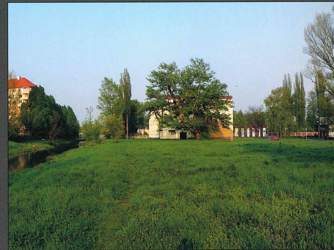
Zbývající budovy mlýnů byly už několikrát přestavěny