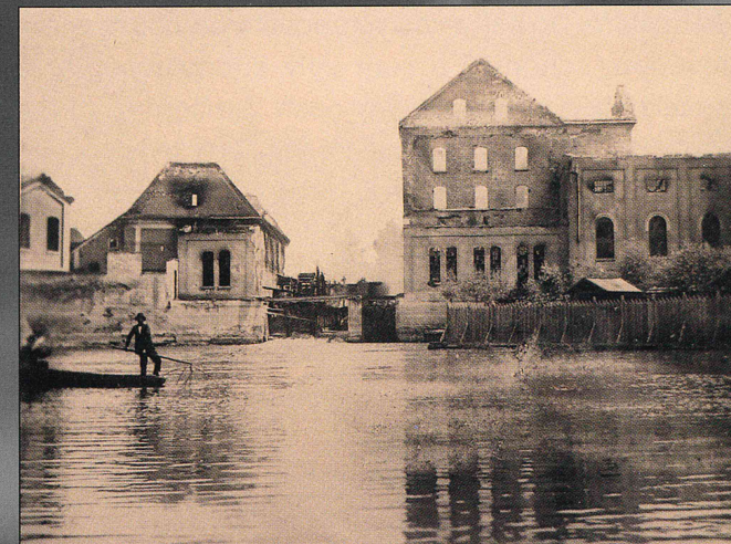
Uprostřed je zřetelně vidět místo, kde bývalo vodní kolo.