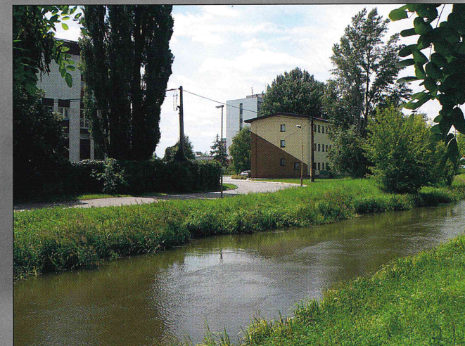
Současný pohled na místo někdejších mlýnů, uprostřed budova St. okres. archívu