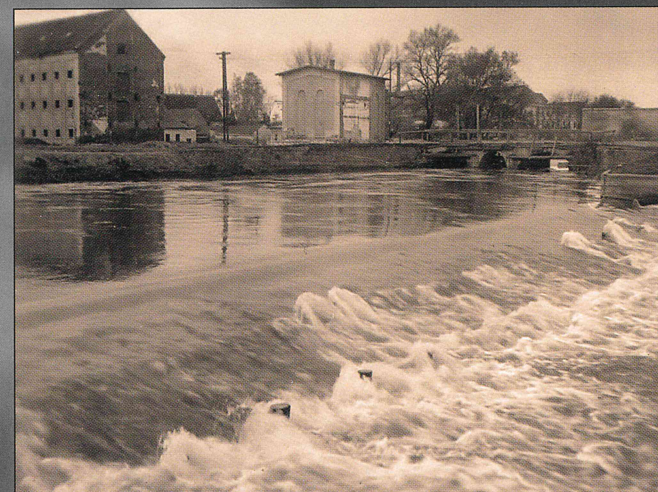
Doprava odbočuje Jalová strouha, rovně jsou městská stavidla